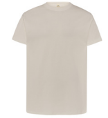
PREP. FOR DYE