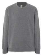
DARK GREY MEL.